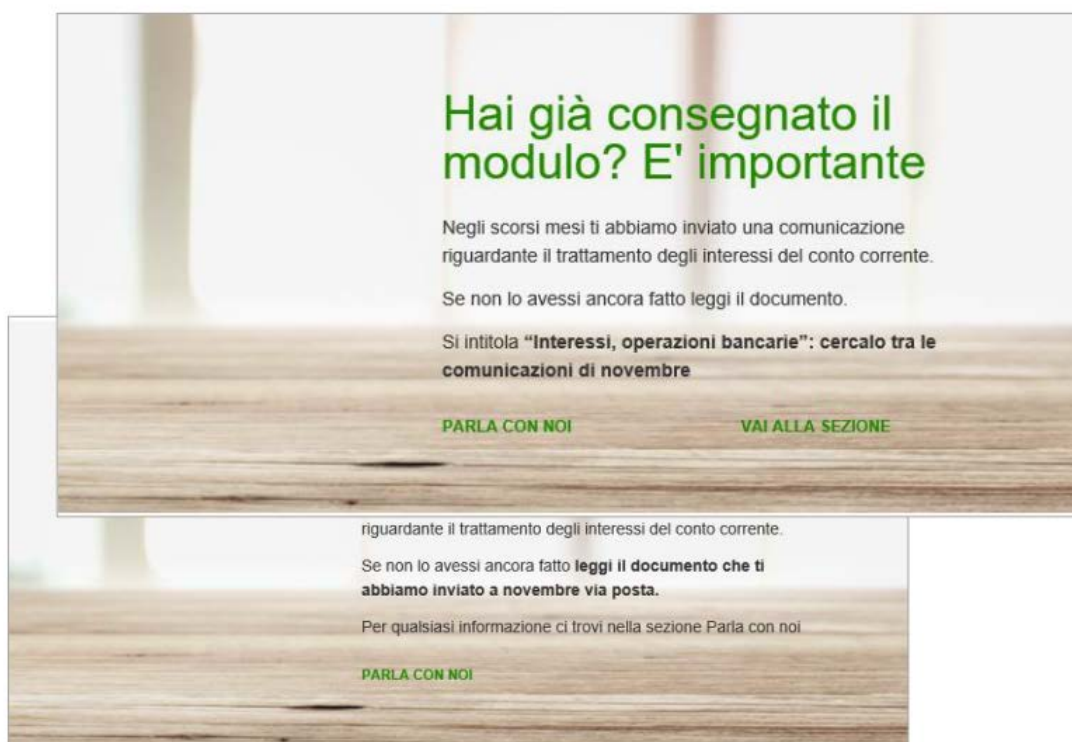
FIG. 5 Banca online

59. Inoltre, con riferimento all' internet banking , la Banca ha implementato dal 14 marzo 2017 la funzionalità della scelta in remoto via internet banking di autorizzare o meno l'addebito in conto degli interessi debitori per tutti coloro i quali non avevano ancora effettuato la scelta.